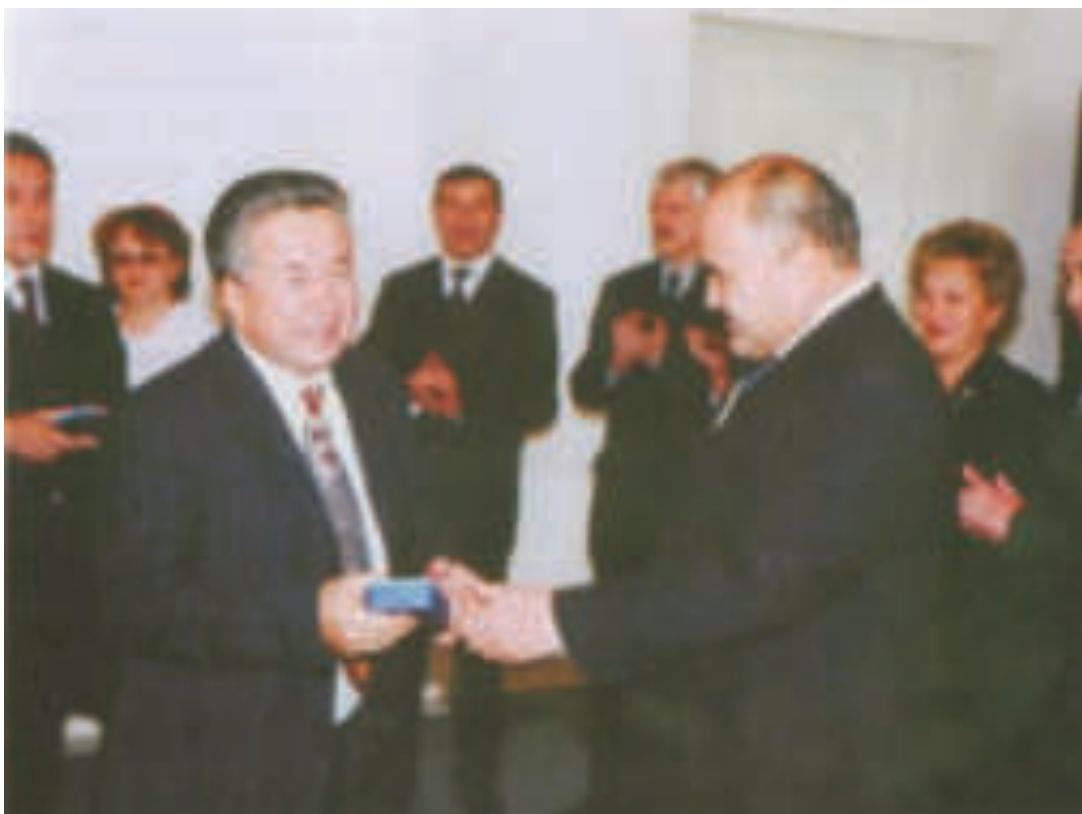
Астана қаласының әкімі Ө.Шөкеев «Парасат» орденін тапсырып тұр.(2004ж.)