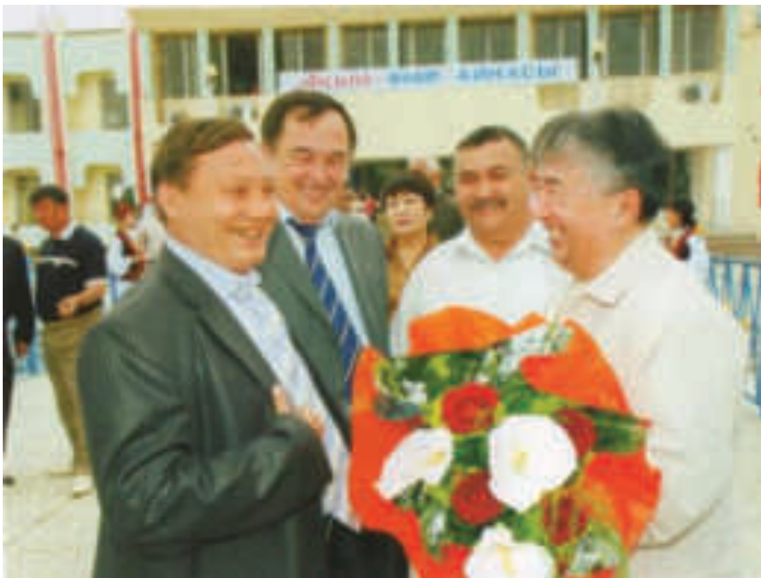
Шымкент жеріндегі шырайлы кездесу (2007 ж.)