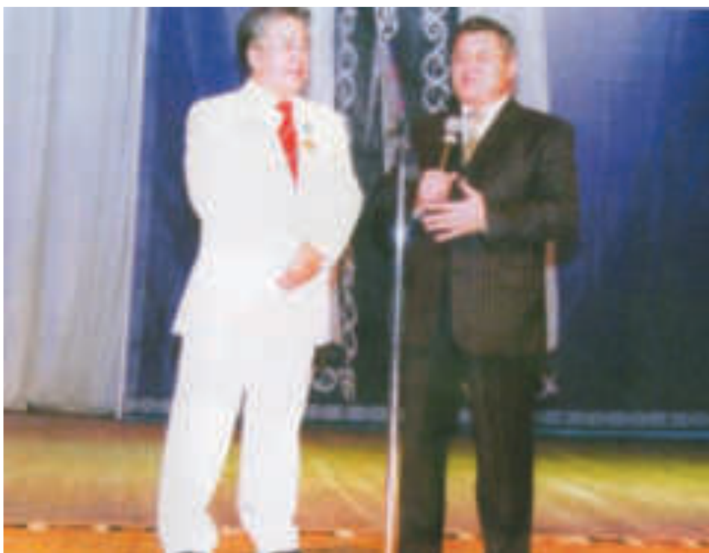
Қостанай облысының әкімі С.Кулагиннің құттықтауы (2005 ж.)