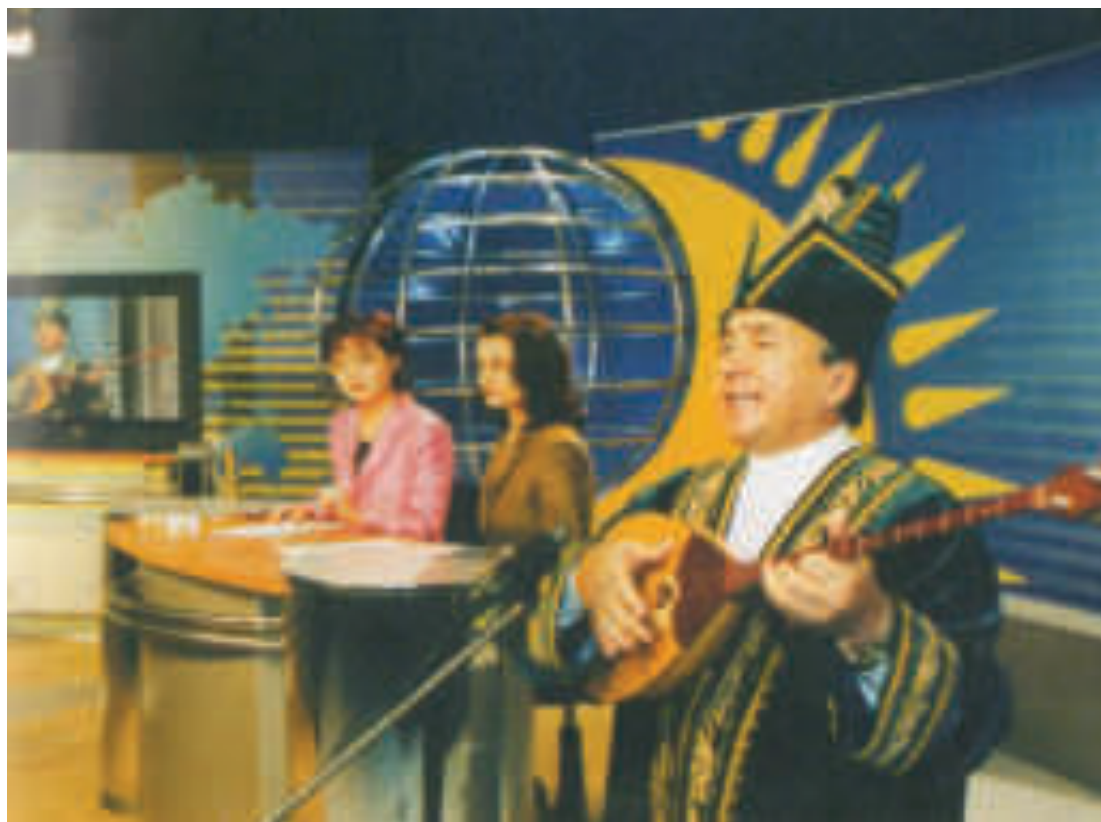
«Қазақстан» телеарнасының мерейтойы