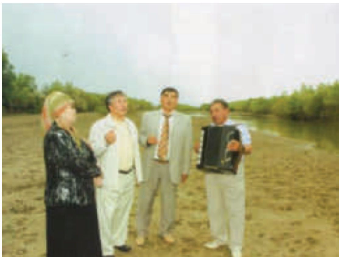
Шәмші әні шырқалғанда...